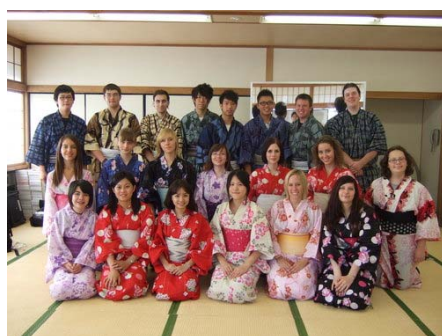
東京九段日本語學校 Kudan Japanese Institute