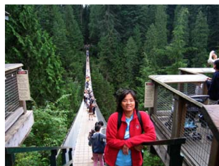
溫哥華 英文學院 Vancouver English Center