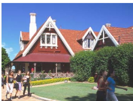
雪梨 Embassy 英語學院