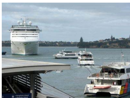
奧克蘭 NZLC 語言學校 New Zealand Language Centre