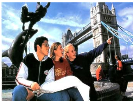
倫敦 Kaplan 英語學院